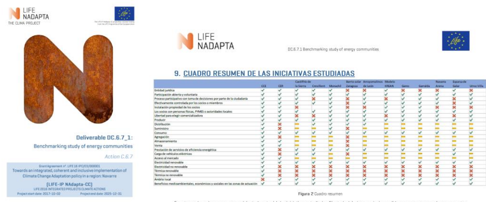
En este cuadro se hace un resumen del estado actual de las iniciativas estudiadas. El estado del mismo variará a medida que vayan avanzando sus proyectos.