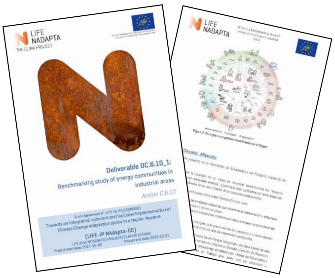
Benchmarkings de CE y hoja de ruta para su impulso en Navarra