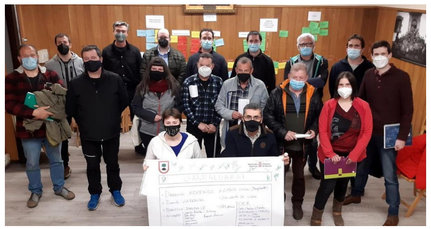
Acompañamiento en procesos participativos