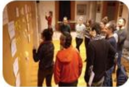
SESION 1 Principios y valores