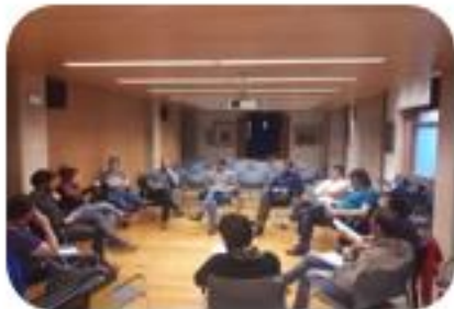
SESION 3 Participación