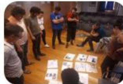
SESION 4 Preparación visita