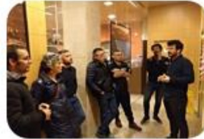
SESION 2 Identificación de Agentes