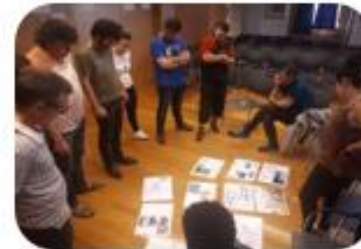
SESION 4 Preparación visita