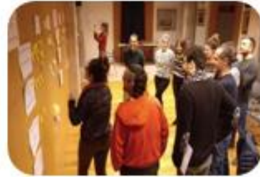
SESION 1 Principios y valores