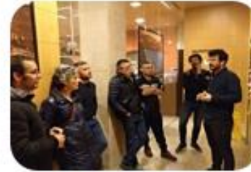
SESION 2 Identificación de Agentes