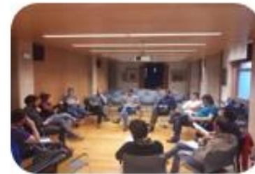
SESION 3 Participación