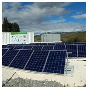
Microrred de Lizarraga