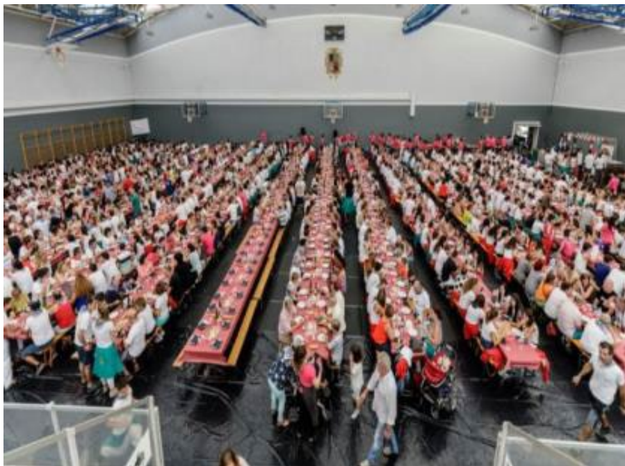
Vajilla y cubertería reutilizable