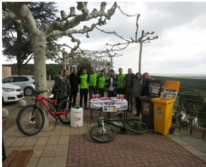
BTT Ibaigorri de Lerín, europeo de patinaje y P2P Zubiri – Puente la Reina / Gares