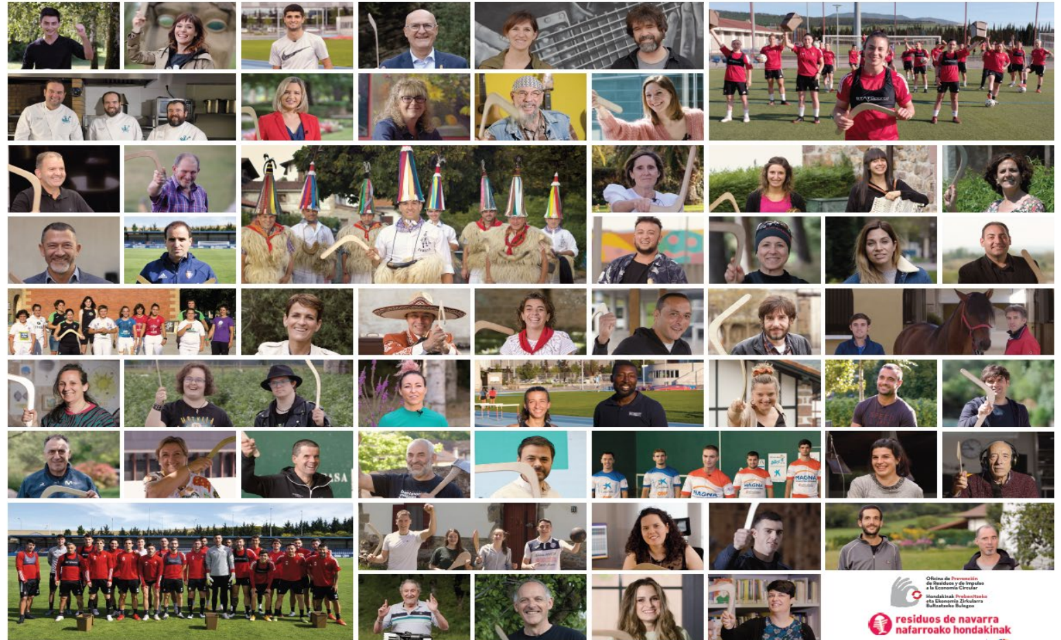
NAVARRA SE APUNTA A LA ORGÁNICA

EFFECTO BOOMERANG... YO ME APUNTO, BAT EGIN... NAVARRA SE APUNTA A LA ORGANICA / NAFARROA ORGANIKOAREKIN BAT