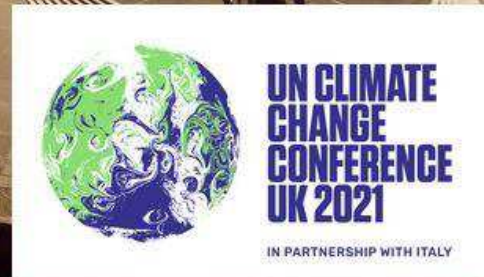
Imagen: Glasgow. Stephen O'Donnell-Unsplash